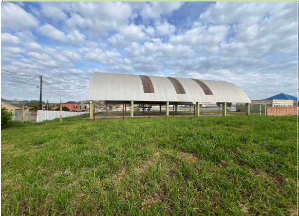
FOTO 3 - VISTA LATERAL ESQUERDA