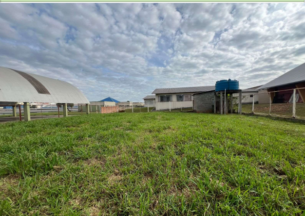
FOTO 4 - FUNDOS