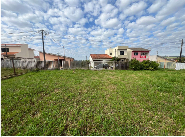
FOTO 7 - Vista do lote para a VIA

Município: Ibaiti Projeto: Estabelecimento de Ensino (Creche/Escola)