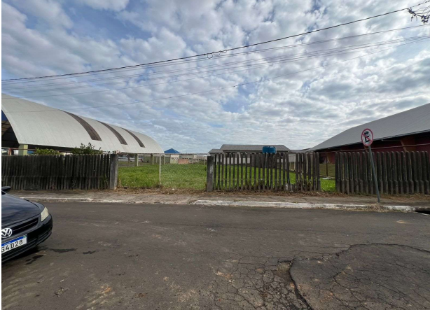
FOTO 1 - VISTA FRONTAL

Estabelecimento de Ensino (Creche/Escola)